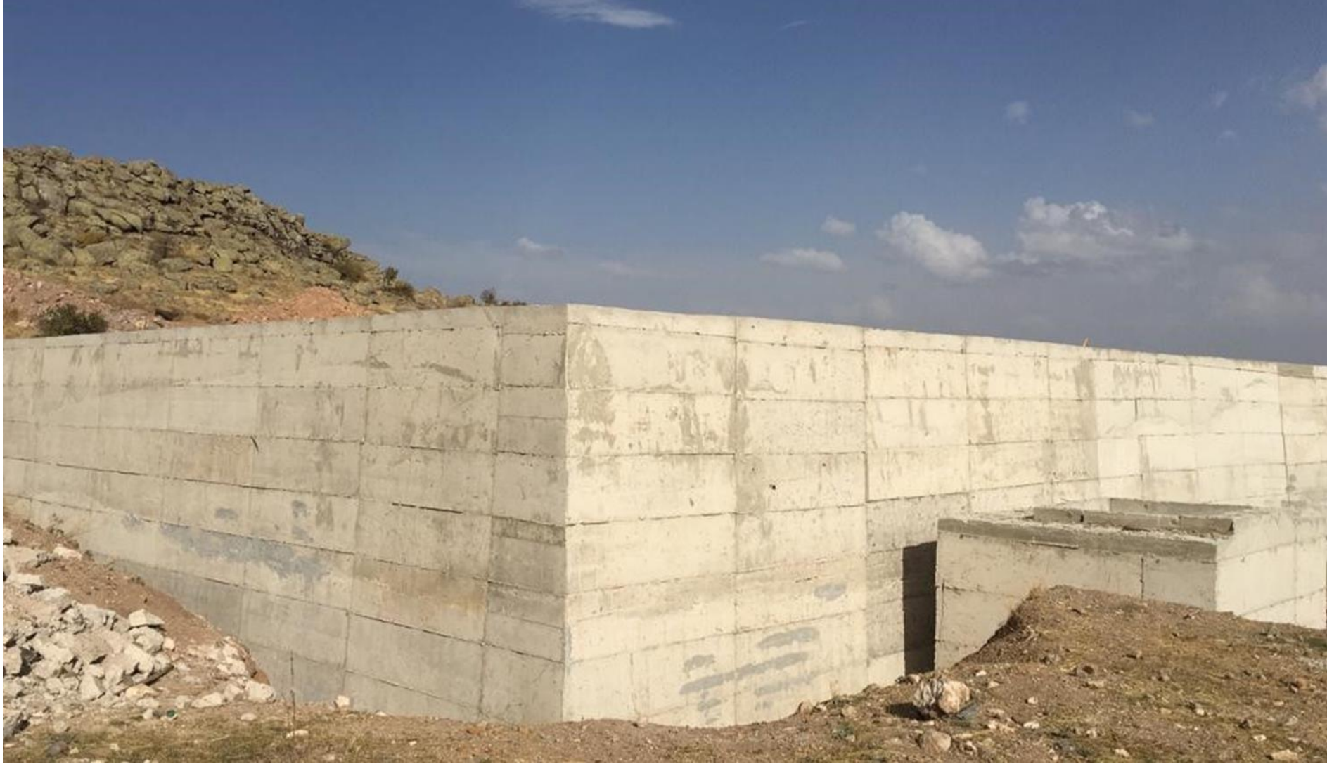
Su Alma Havuzu